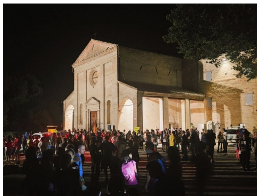
SANTA CROCE ED IL PERCORSO

Il PUNTO RISTORO con bevande e panini gestito dagli Amici di Santa Croce sarà aperto.